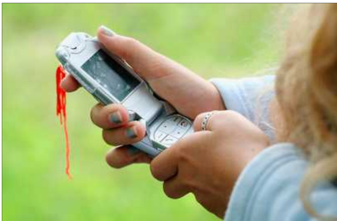
■ L'identité d'un émetteur de SMS n'est pas fiable. Les utilisateurs jeunes ou crédules doivent en être avertis.